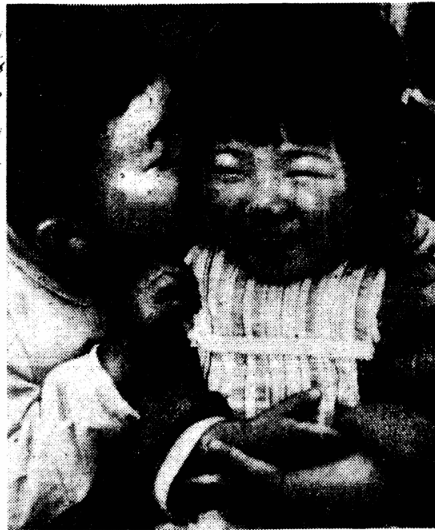
Снимок из южнокорейского журнала «Чужой шаг»

У ребятшек планеты Свои, особые секреты. Все удивительно пока Для их лукавых глаз: И лес, и небо, и река, Привычные для нас. Мы детям навсегда хотим Оставить небо голубым, Зеленым — шестелестящим лес, Прозрачной — воду в речке. А пламя, и золу, и дым Пусть видят только в пещке! Я. АКИМ